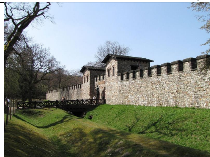
Entrée principale du fort romain de Saalburg - Allemagne