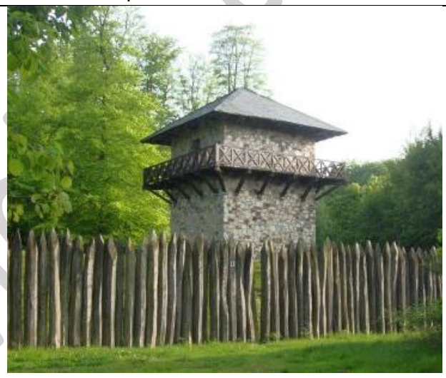
Palissade et tour de garde du fort Zugmantel - Allemagne