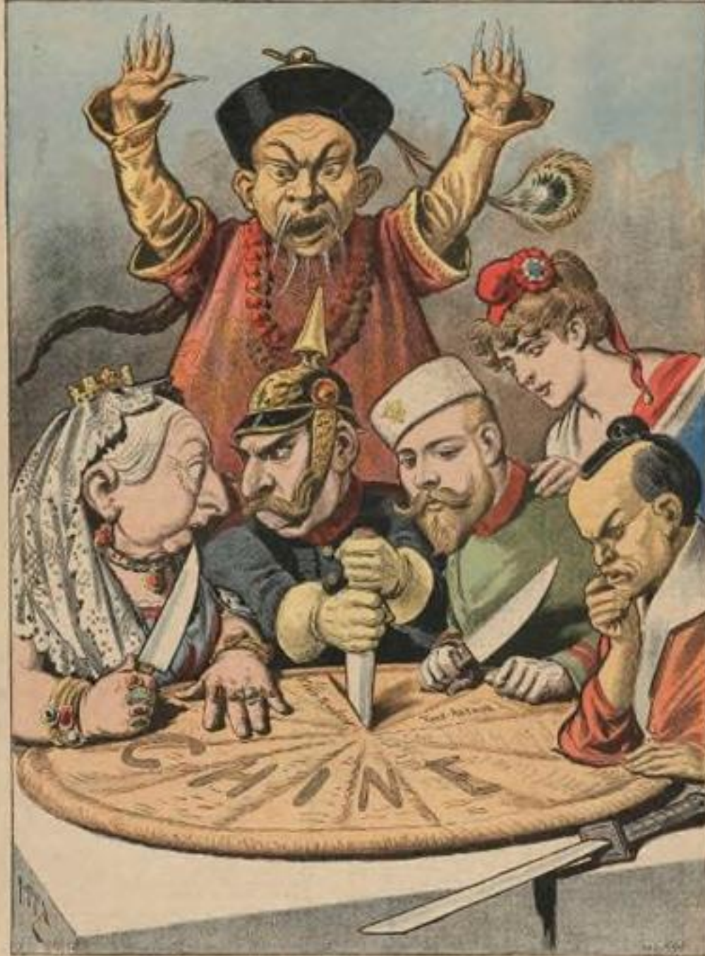
EN CHINE Le gâteau des Rois et... des Empereurs

« En Chine, le gâteau des rois et ... des empereurs » H. Meyer Petit Journal, 1898